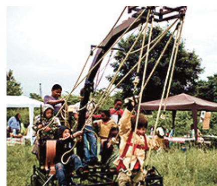
Édition 2019 - Cie du Fer à Coudre

Restez connectés pour découvrir le détail de la programmation.