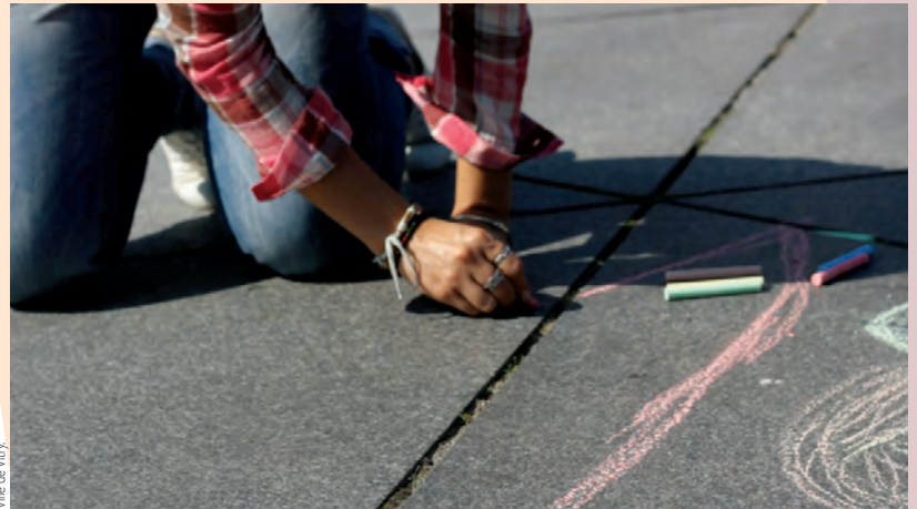
Ville de Vitry

La ville de Vitry organise cette année la 4 e édition de Mur/Murs , semaine des cultures urbaines. L'événement aura lieu du vendredi 23 septembre au dimanche 2 octobre .