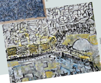
Mohamed Akssouh • détail